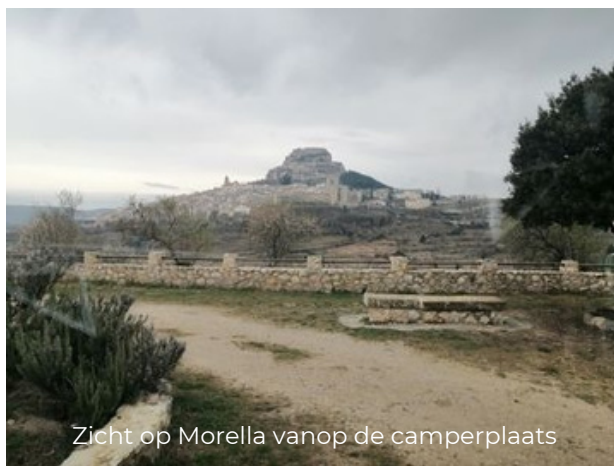
Zicht op Morella vanop de camperplaats

Het is een fikse wandeling van de stadspoort naar het kasteel, maar de mooie smalle straatjes met winkeltjes, bars en restaurants maakt het gezellig. Dames, laat je zeker verleiden tot de aankoop van een mooie sjaal met zijn typische "floskes". Het beeld van de man die deze sjaal eigen maakte aan dit stadje kom je onderweg tegen. Net buiten de stad kom je ook nog voorbij de aquaduct uit de 14de eeuw.